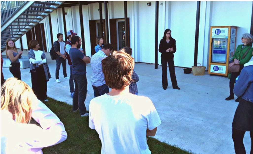
Inauguration du Frigo Zéro Gasp® à Bordeaux Sciences Agro

" Tout seul on va plus vite, Ensemble on va plus loin ! "